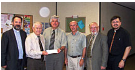
Представники Фундації ІІМАШ та Університету Святого Павла (червень 2005)